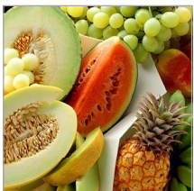
Melones / Sandías

Ejemplos de productos que puede contener el Bulk Container.